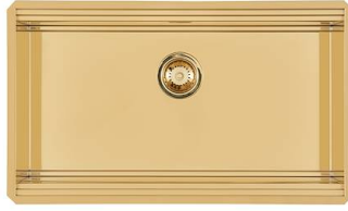
RIVA 750 GOLD SOUS PLAN N034 S59