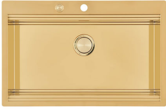
RIVA 750 GOLD N034 F59